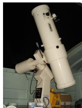
31cmニュートン式反射望遠鏡