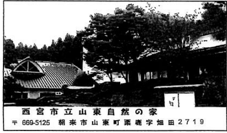
西宮市立山東自然の家

※ハガキ配達について 和田山郵便局窓口 → 配達日時 月曜日の19時まで → 水曜日 火曜日の19時まで → 木曜日 水曜日の19時まで → 金曜日 ※土日祝は配達していません。祝日を 挟む学校は気を付けてください。